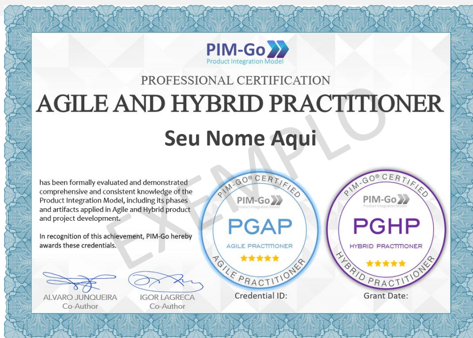
Ilustração da certificação

É expressamente vedada a reprodução, total ou parcial, do conteúdo do Exame, bem como sua execução em formato que não seja estritamente individual.