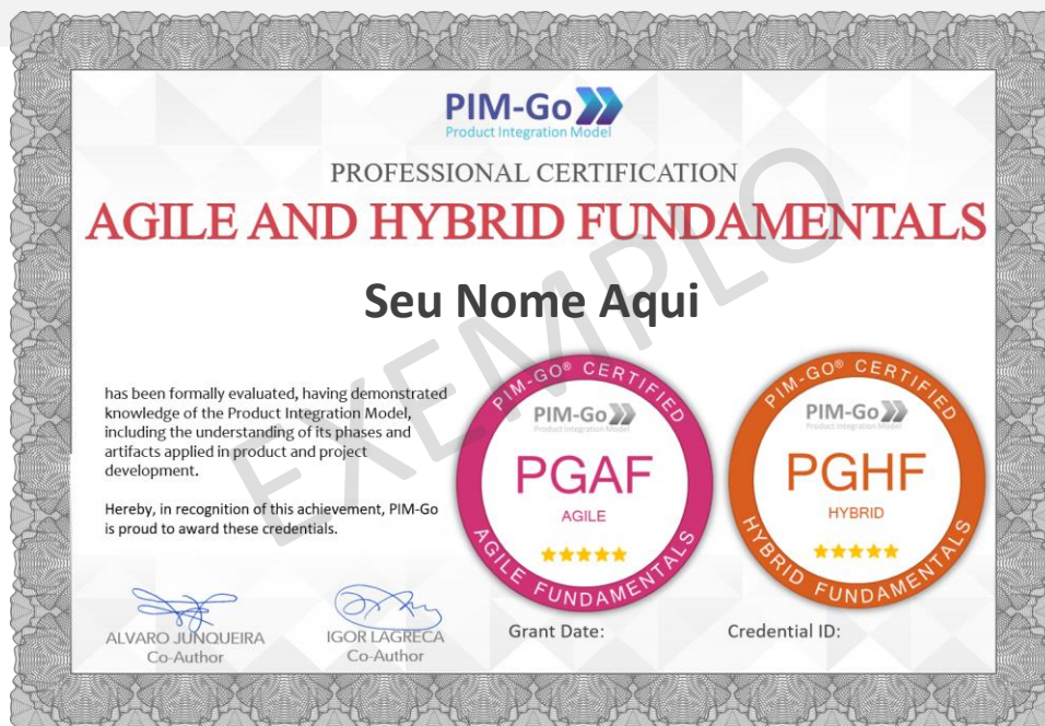
Ilustração da certificação

É expressamente vedada a reprodução, total ou parcial, do conteúdo do Exame, bem como sua execução em formato que não seja estritamente individual.